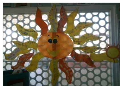
CEIP Gloria Fuertes (Guadalajara)