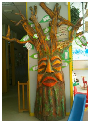
El Pandora (Leganés, Madrid).