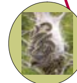
ORUGAS SALIENDO DEL BOLSON

Las mariposas se aparean en verano. La hembra pone sus huevos sobre las copas de los árboles y, 30 ó 40 días después, nacen las orugas (generalmente en los meses de septiembre-octubre). Las propias orugas construyen sobre los árboles sus nidos, en los que pasan el invierno. Entre febrero y abril, las orugas descienden al suelo desde sus nidos, en características filas indias (de ahí su nombre común de "procesionarias"). Finalmente, se entierran en el suelo, donde pasan a la fase de crisálida. En verano las crisálidas hacen eclosión, y surgen las mariposas, que se aparean, comenzando un nuevo el ciclo, que se repite año tras año.